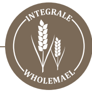
Pasticciotto integrale crema e mele custard and apples