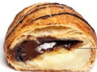
Cornetto crema e nocciola custard and hazelnut cream