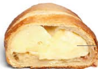
Cornetto crema custard