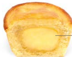
Pasticciotto crema custard